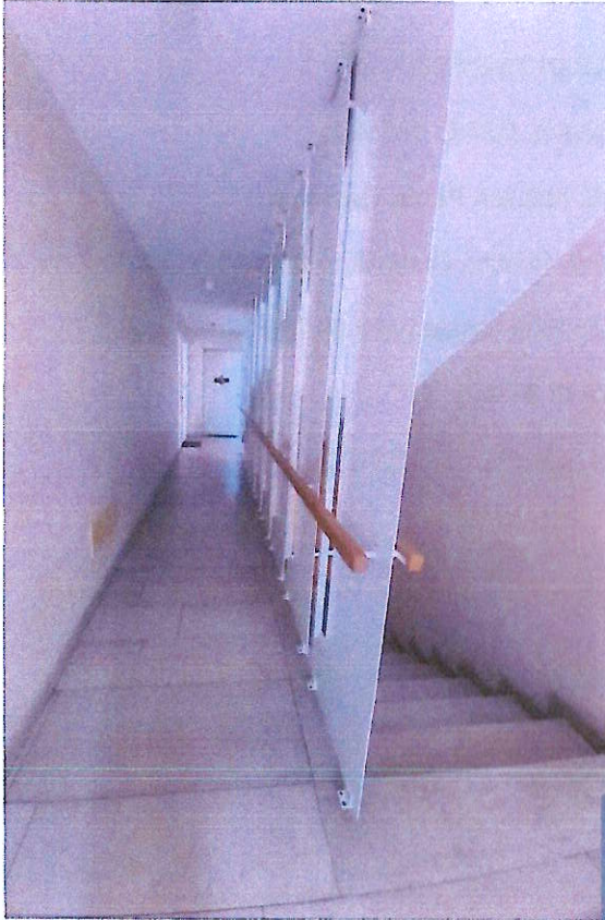
Vano scale condominiale