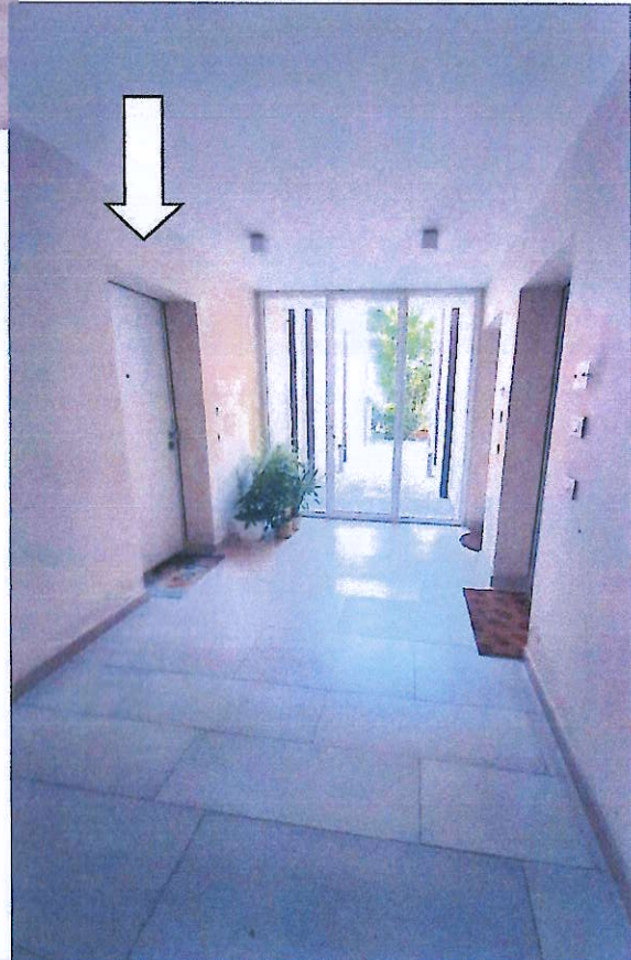
Portoncino d'ingresso all'abitazione