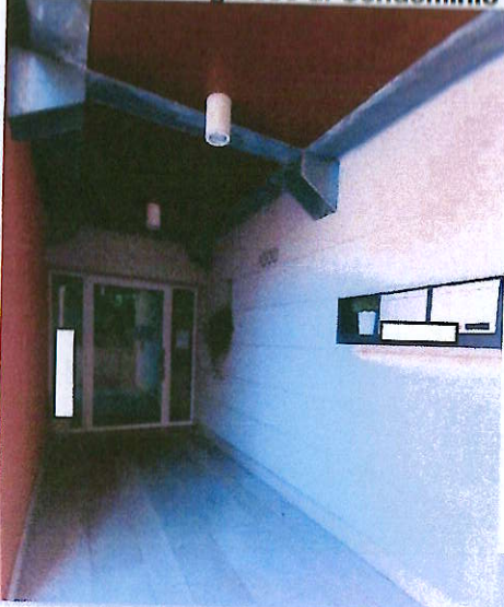
Portoncino d'ingresso al Condominio