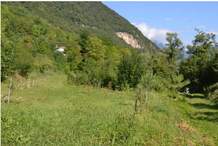
foto n. 17 – terreno a nord del fabbricato – sulla destra la strada consortile di accesso al lotto