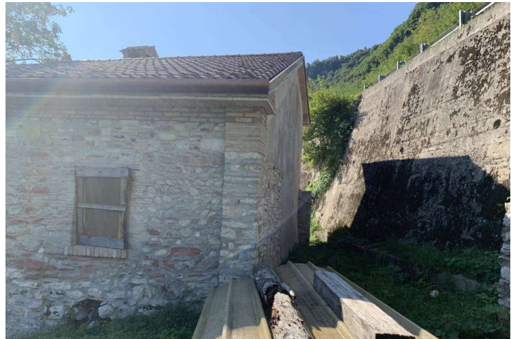
foto n. 3 – parte prospetto nord e prospetto est verso scarpata SR Feltrina