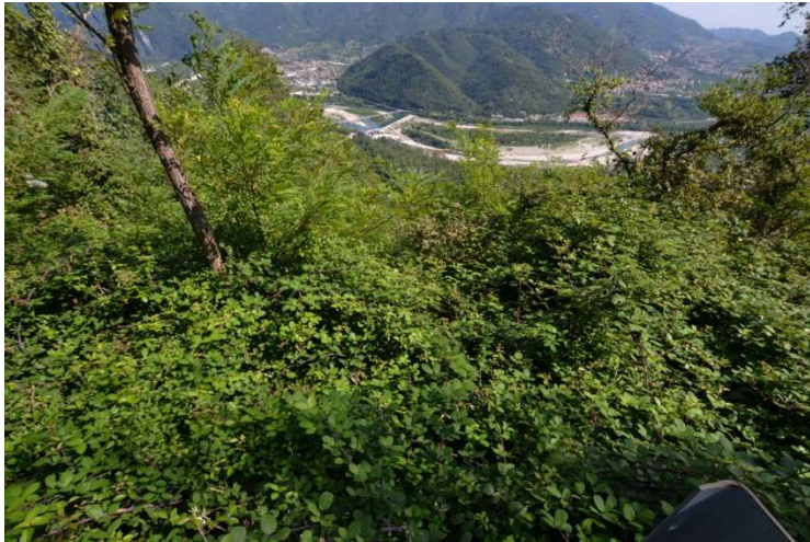
foto n. 3 – vegetazione (rovi e specie lianose) predominante nel lotto - giacitura del terreno molto acclive