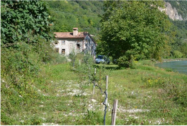
foto n. 13 – terreno a sud del fabbricato - ulivi e sulla destra canale Brentella