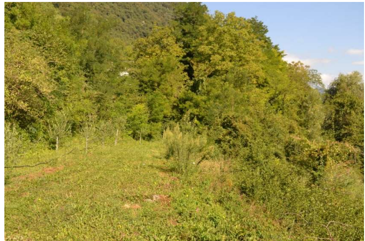
foto n. 18 – terreno a nord del fabbricato verso confine nord del lotto