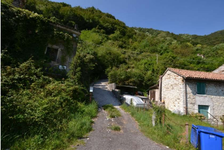
foto n. 1 – accesso al lotto dalla SR Feltrina - presenza di cancello chiuso alla fine della strada