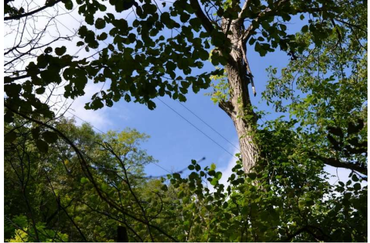
foto n. 2 – cavi aerei di linee elettriche elettrodotti in direzione nord-sud